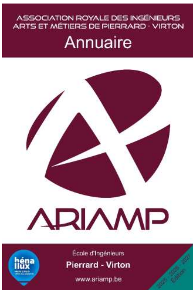
Figure 1 - Page de garde du prochain annuaire

Les étudiants le consultent régulièrement en vue de la recherche d'un stage ou de références et autres expertises afin de mener à bien divers projets. La mise à jour des données est faite tous les deux ans et donc l'annuaire constitue pendant cette même période un outil de référence très apprécié.